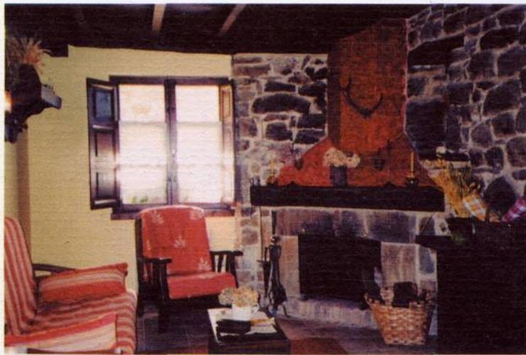
Salón con chimenea